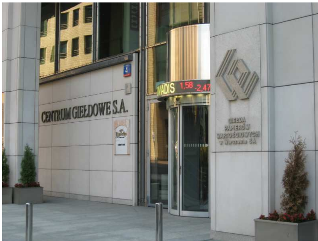
Rysunek: GPW w Warszawie.